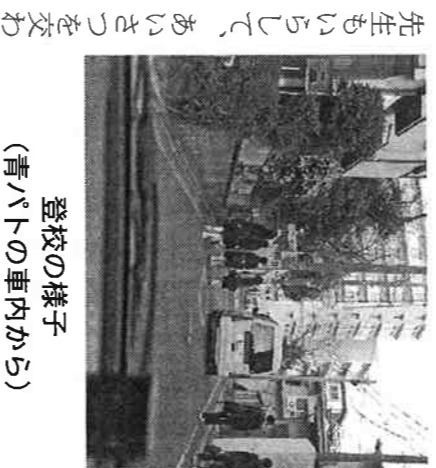
登校の様子 (青パトの車内から)